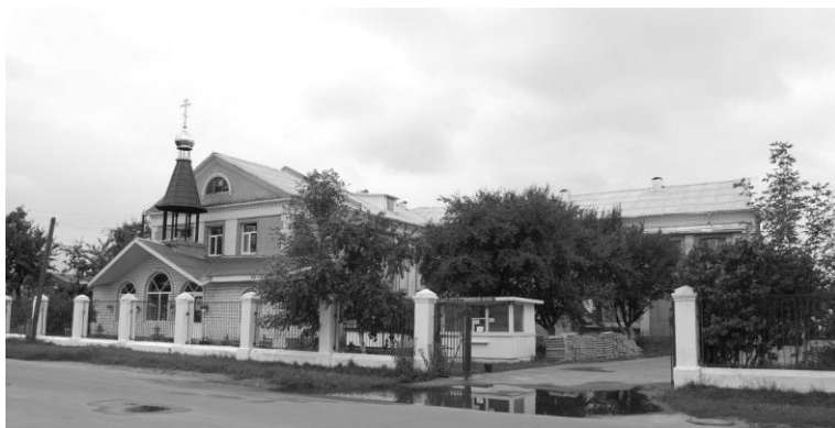
Мал.5 Гомельскі Свята-Ціхвінскі жаночы манастыр

структуры. Адмоўны — немагчымасць пашырэння тэрыторыі, месца ў структуры паселішча, першапачаткова прызначанае пад іншую функцыю, не адпавядае спецыфіцы манастырскага комплексу.