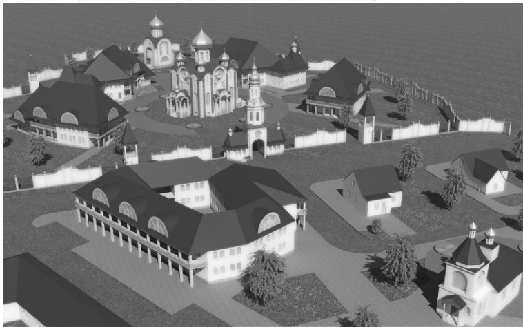
Мал.4 Лаўрышэўскі Свята-Елісееўскі мужчынскі манастыр (праект)

- стварэнне манастыра на месцы яго сацыяльнага служэння .