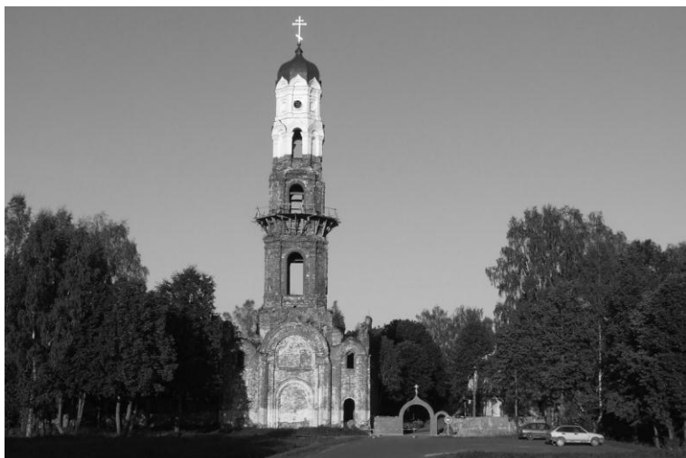
Мал.3 Пустынскі Свята-Успенскі мужчынскі манастыр